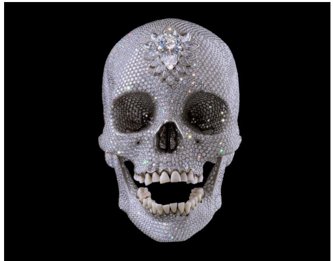
Damian Hirst, For the Love of God , 2007, Sculpture platine et diamant