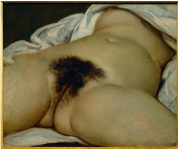
Gustave Courbet, L'origine du monde , 1866, huile sur toile, 46 x 55 cm, Paris, musée D'Orsay