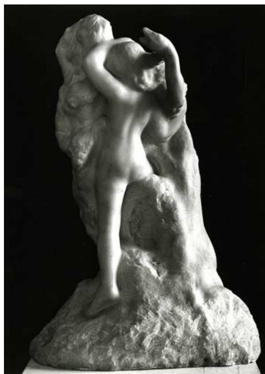
August Rodin, Eve et le Serpent, 1901, Marbre, H. 50 cm ; L. 33,4 cm, P. 22,6 cm, Paris, musée Rodin