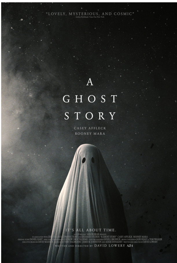
David Lowery, A Ghost Story , 2017 États-Unis