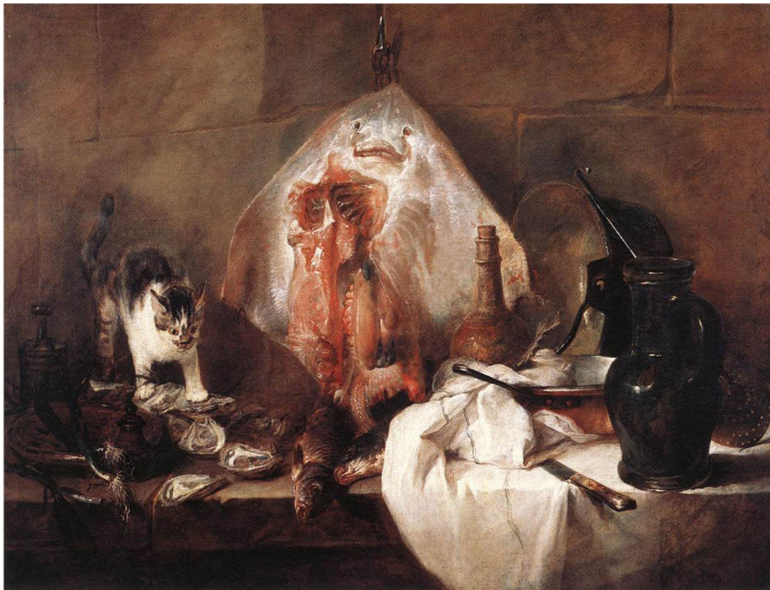
Jean Siméon Chardin, La Raie, 1728, Huile sur toile, 114 x 146 cm, Paris, Louvre