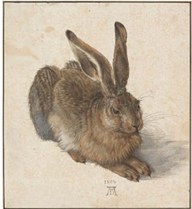
Albrecht Dürer, Le lièvre, 1502, Aquarelle et gouache sur papier, 25,1 × 22,6 cm, Vienne, Graphische Sammlung Albertina