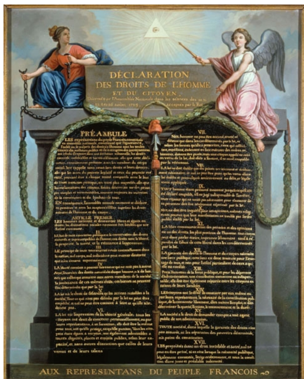
Le Barbier, Déclaration des droits de l'homme et du citoyen de 1789, vers 1791, huile sur toile, 71 x 56 cm, Paris, musée Carnavalet.