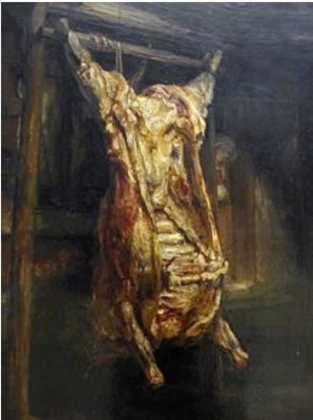
Rembrandt, Le Bœuf écorché, 1655, Huile sur bois, 94 × 69 cm, Paris, Louvres