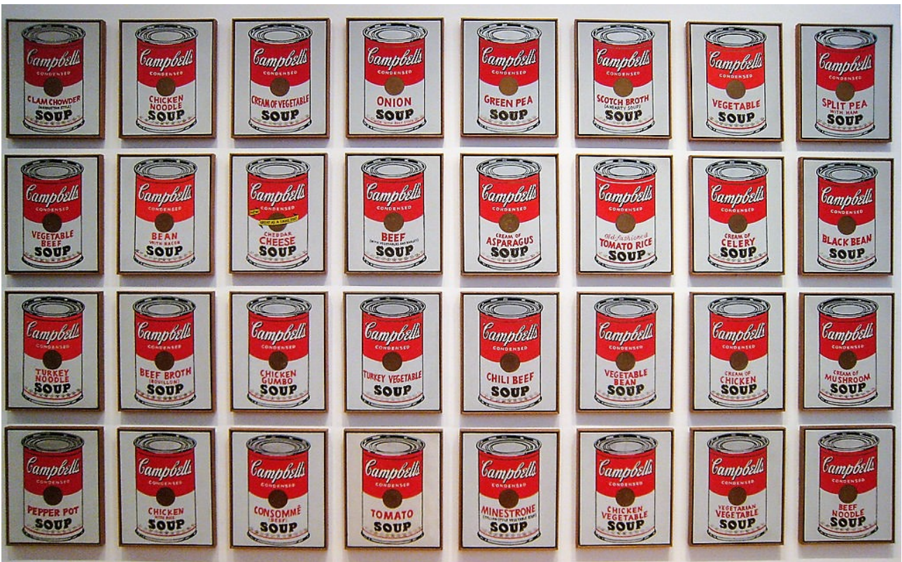
Andy Warhol, Campbell's Soup Cans, 1962, acrylique et liquide peint en sérigraphie sur toile, 510x410cm, New York, Moma